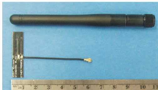
外付けアンテナとPCBストリップアンテナ